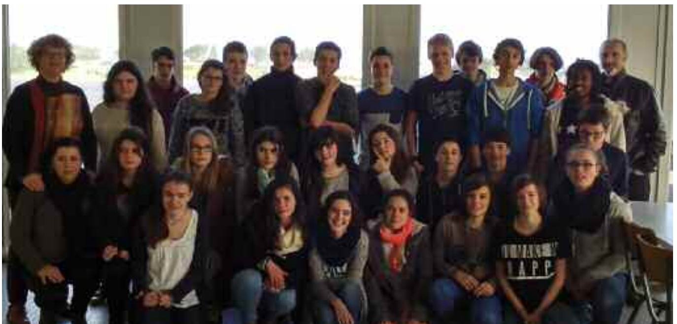
Hautzaro ikastolako ordezkaritza, Diwan sareko eskoletako batean.

Europako hizkuntzen A2 mailari jarraiki Rennesko Akademiak egindako ebaluazioen arabera, Diwan Eskoletako (Diwan Skolaj) ikasleen konpetentzia hazten ari da bretoiari dagokionez. Era berean, PISA ikasgaien ebaluazioen emaitzen arabera, Frantziako batzuek bestekoaren gainetik daude. Ikastetxe horien arrakasta-faktoreetako bat, zalantzarik gabe, zera da: familiekin bere seme-alaben hezkuntza-prozesuan duten inplikazioa eta, bereziki, bretoi herriaren kulturaren eta nortasunaren sustapenean erakusten dutena.