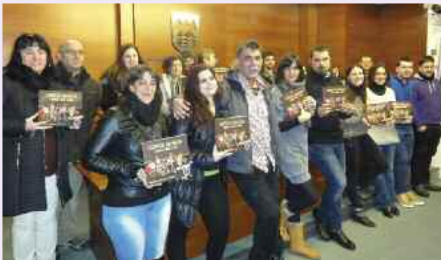
22 elkarteetako ordezkariak eta Irrien Lagunak-eko kideak liburu-diskoaren aurkezpenean.

Behar bereziak dituzten haurren eta horien familien bizi-baldintzak hobetzeko lan egiten duten elkarteei egitura eta proiektu egonkorak emateko asmoz, Gizartekintza Elkarteak sortu zuen Irrien Lagunak Klubak 2013an. Orduetik askotariko ekimenak egin dituzte, besteak beste, elkartasun-jaialdiak, ikuskizunak, abestiak... Jarduera guztietan, bi osagai egon dira ezinbestean: bizipoza eta auzolana. Otsail honetan beste pauso bat eman dute elkartasun bide horretan, eta, hainbat eragileren arteko auzolanetik, “Bizipoza Auzolan. 22 elkarte, 22 ipuin, 22 abesti” liburu-diskoa sortu dute.