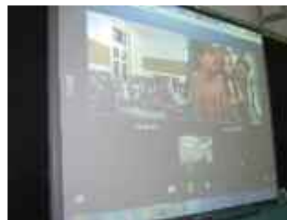
Skype bidez egin dituzte bilerak.