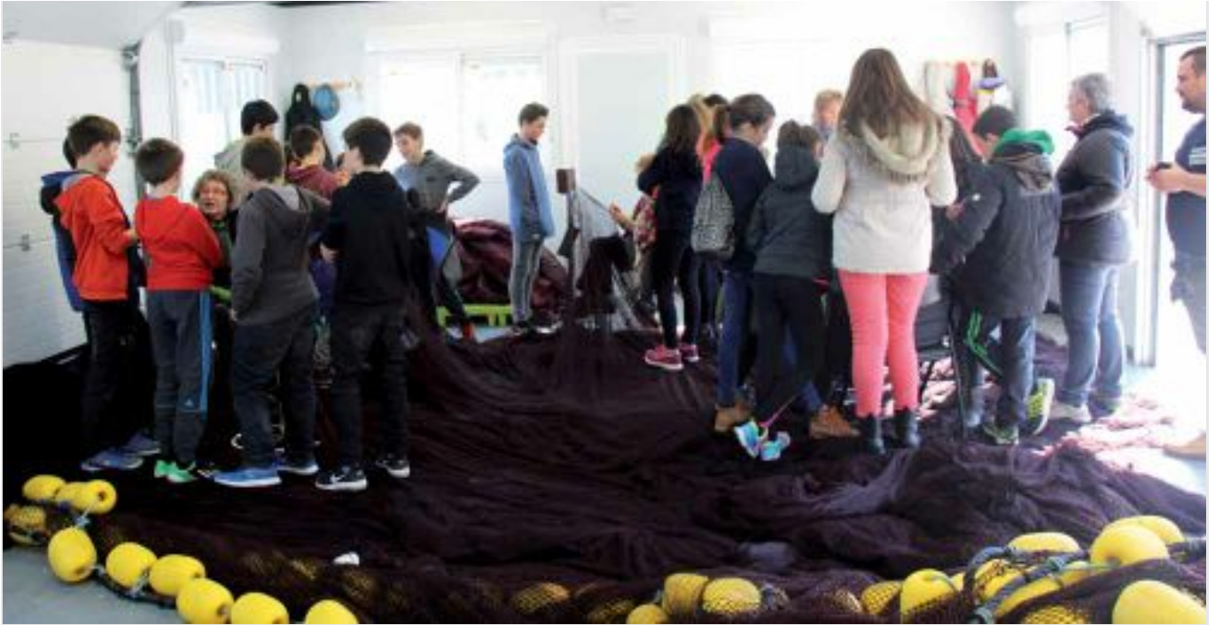
Aztarnen Ibilbidea egiten ageri dira argazkian LH6ko ikasleak.

karia prestatzea? Edota ardura hori emozionala ere izan daiteke? Gaixo gaudenean nork zaintzen gaitu?... Galdera horiei eta antzekoei erantzunez, ohartzeko gara zaintza lanak erabat inbisibilizatuta dauzkagula, eta gainera, orokorrean, emakumeek lan horien askoz ere zama handiagoa hartzen dutela euren gain”.