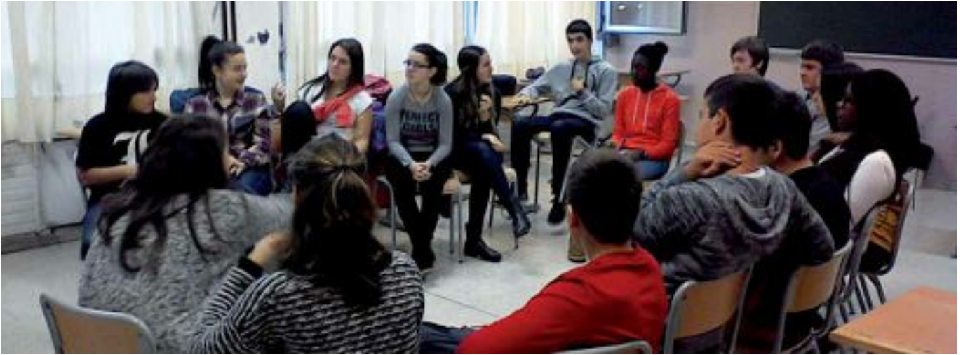
DBH3ko ikasleak indarkeria sexistaren gaia lantzen.

bultzatzeko, eta genero estereotipoen mugak nahiz jokabide sexistak gainditzeko”, argitzen du Baltarrek.