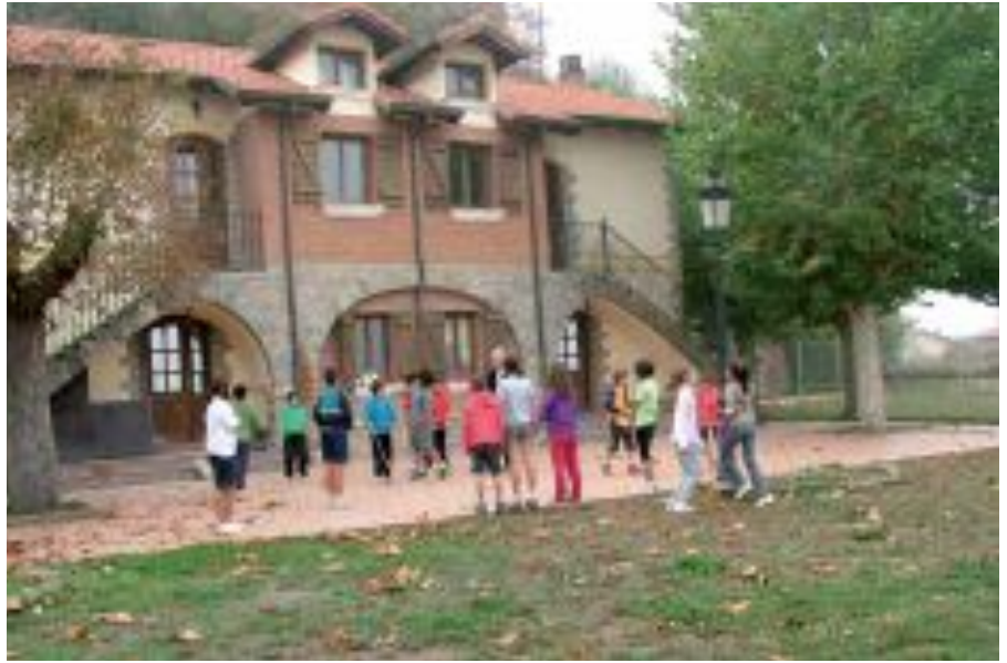
Trokonizeko Geroa eskolan Waldorf pedagogian oinarrituz egiten dute lan.

Eskola-ordu printzipalak dira eguneko lanaren ardatzak, eta gaiak periodikoki lantzen dira. Goizeko lehen bi orduak izaten dira eskola-ordu nagusiak, eta arnasketa-saio baten antzera antolatzen dira. Lehenengo, atal erritmikoa garatzen da. Saio horretan, mugimendua,