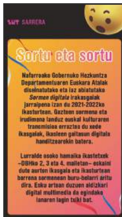
Zut aldizkari digitalaren sarrerako orria.

liteke: hautazko ikasgai modura edota diziplinarteko proiektu gisa. Ikastetxe bakoitzak erabakitzen du