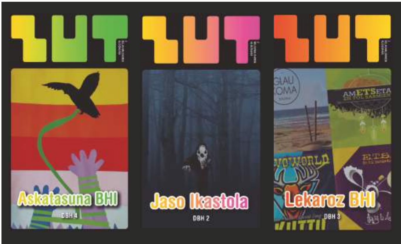
Zut aldizkari digitalaren hainbat azal.

zein mailatan eta zein formatutan eskaini nahi duen. Era batera edo bestera lantzen dela, diziplinartekotasunari, hau da, hainbat diziplinako irakasleek parte hartzeari, garrantzia ematen diote, eta gaia bost irakasgaitan lantzea aurreikusita dago: Euskal Hizkuntza eta Literatura, Plastika, Musika, Gorputz Hezkuntza eta Teknologia.