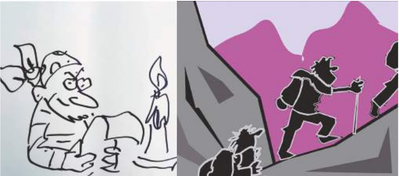
Montxo Lopez de Ipiñak egindako ilustrazioak.

zidatenean entzun nuen lehen aldiz erresilientzia hitza. Lagunek esaten zidaten erresilientzia handikoa naitzela baina hori zer zen ez nekienez, Interneten begiratu nuen. Orduan ikusi nuen erresilientzia arazoan aurrean aurrera egiteko gaitasuna izatea dela. Orduan konturatu nintzen baietz, gaitasun hori badudala. Ikasleei galdetzen diedanean haiek ere baietz esaten dute. Ikasgelan solasaldia egiten dugu: haiek galderak egiten dituzte, nik erantzun, eta une horretan konexioa lortzen dugu.