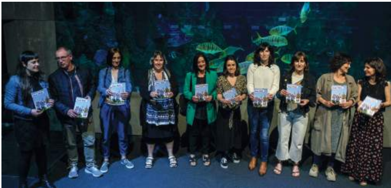
Komunikabideen babesa jaso zuen haziera eta heziketa aldizkariak: Hamaika Telebista , Hekimen , Berria , Elhuyar , Jakin eta Argiarena , besteak beste.