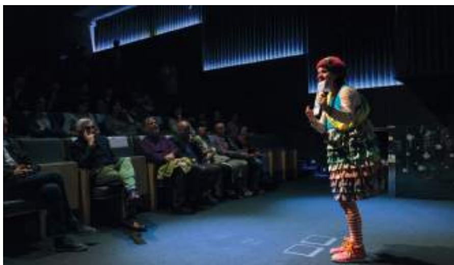
Pituxa clowna HAZI HEZI berriaren ale bat eskuetan duela.