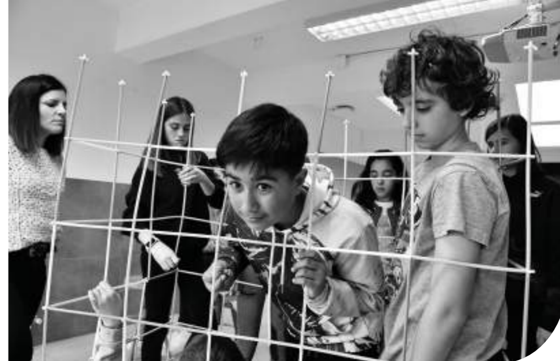
» Haurrak psikologoarekin lanketa bat egiten.

- Ikerketa eta irakaskuntza funtzioak betetzen ditu. Hezkuntza teoriari eta, oro har, psikologiaren eremuari buruzko ikerketak egiten ditu,