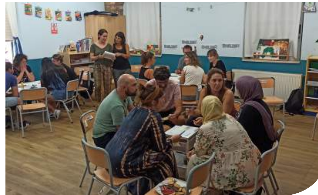
» Lardizabal eskolako hainbat guraso bileran, talde txikietako dinamikan.