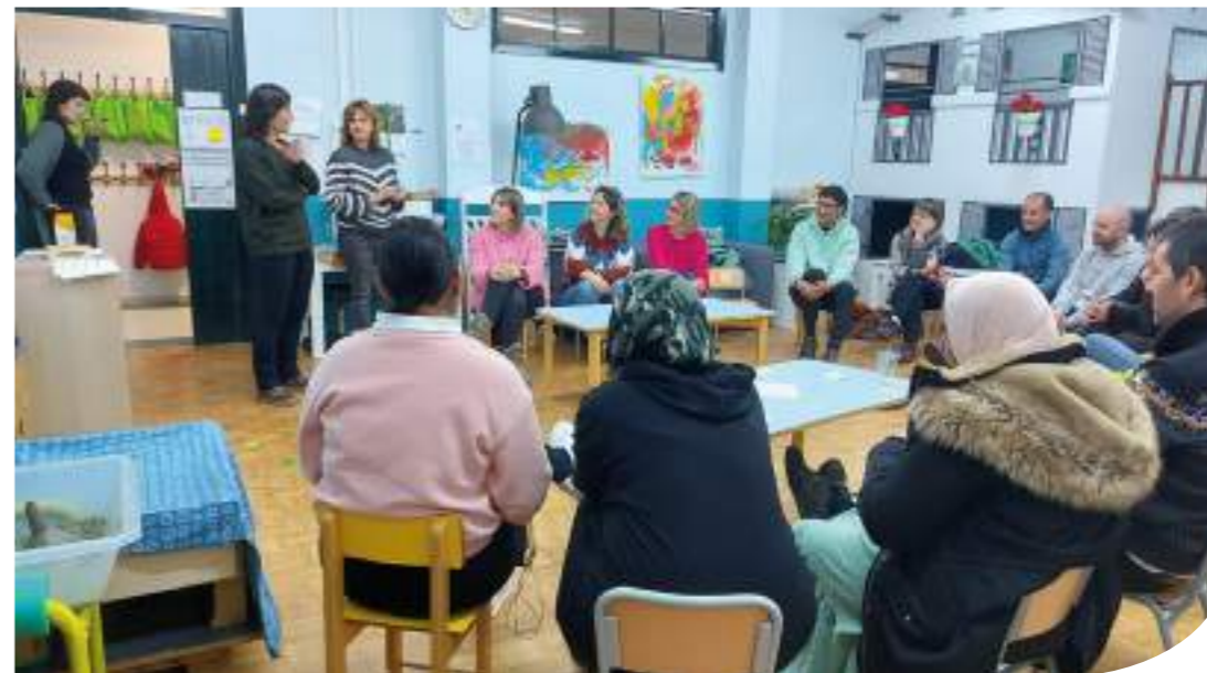
» Irakasleak gurasoen aurrean hizketan, eta atzean beste irakasle bat Telegram bidez itzulpena eskaintzen.

Euskararen erabilerari eutsiz, jatorri ugaritako familien arteko elkarbizitza zaintzeko prozesua egiten ari da Zaldibiako Lardizabal eskola, HUHEZIKo eta UEMAKo adituekin. Ikasturte honetan, urrats bat egin dute aurrera elkarrekin: ikasturte hasierako guraso bilerak eraldatu dituzte. HUHEZIKo Euskara eta kulturartekotasuna hezkuntza komunitateetan jardunaldien bigarren ekitaldian eman dute esperientziaren berri.